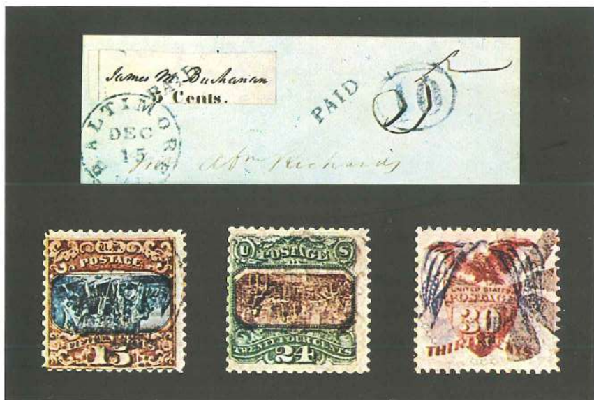
El British Museum brinda albergue a una rica sección filatélica, que contiene piezas raras, incluso de los Estados Unidos, como la carta con el «Jefe de Correos» de Baltimore (1846) y los sellos con el centro invertido. Abajo, la fachada del British Museum de Londres.