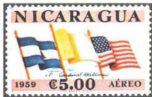
El cardenal Spellman ha fundado un museo filatélico, al que ha donado sus propias colecciones. Arriba lo vemos en compañía de Sor Fidelma, conservadora del museo durante muchos años. Una serie emitida por Nicaragua ha recordado al cardenal.